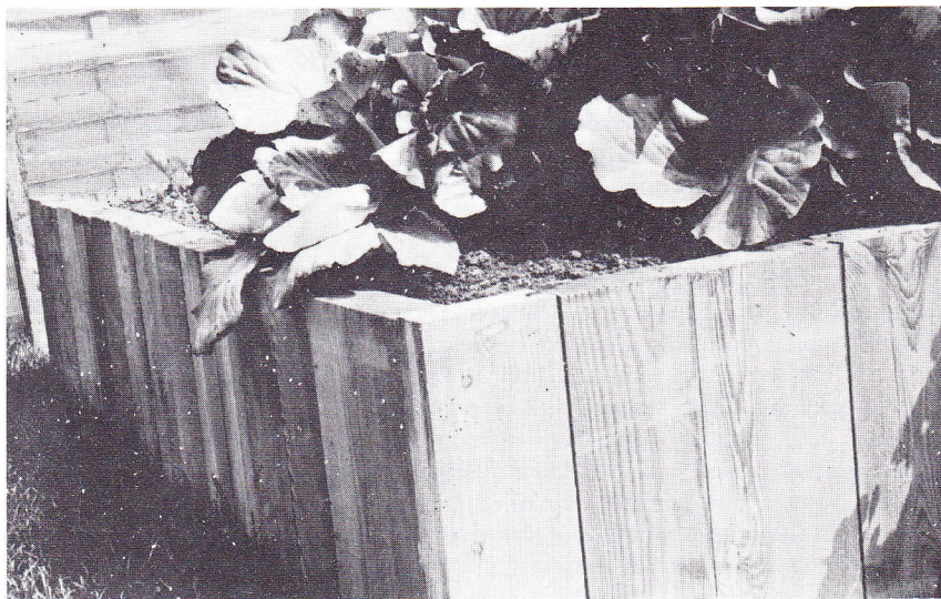
Verhoogde bak van geprofileerde planken.

De keuze van de gereedschappen hangt af van de aard van de functiebeperking van de tuinier. Klein handtuingereedschap met korte stelen is het meest praktisch voor het onderhoud van verhoogd aangelegde borders. Gereedschappen met extra dik handvat zijn gemakkelijker vast te houden door iemand met een verminderde handkracht. Voorgevormde handvatten of handvatten met een profiel liggen vaster in de hand. Voor het bewerken van borders in de volle grond zijn lichtgewicht gereedschappen met een lange steel aan te bevelen boven de normale zwaardere.